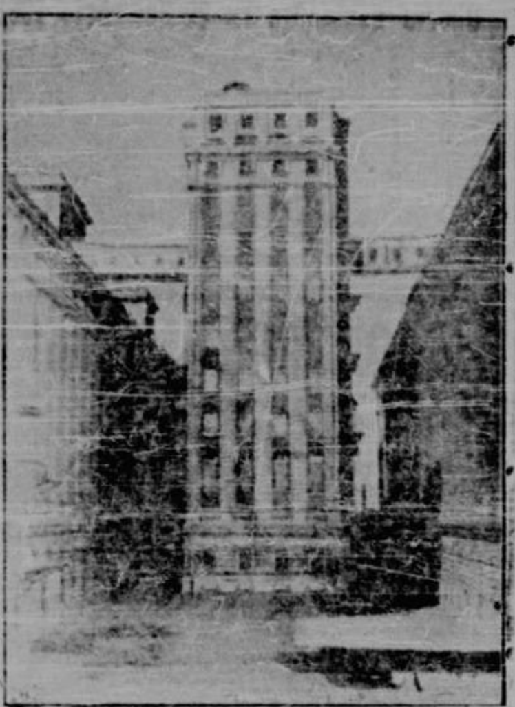
Constanța — Uscătoria de porumb