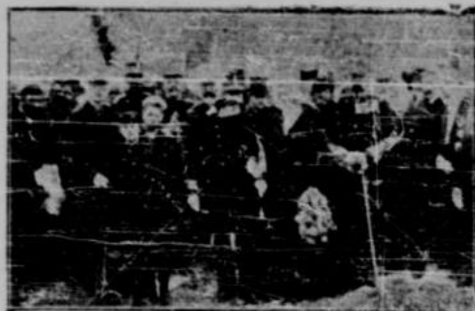
Viața Regelui Carol I în Hârșova — 1904